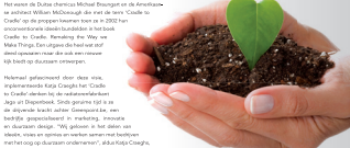
Clara De Weert

Het klinkt misschien een beetje surrealistisch en een beetje utopisch, maar is in de praktijk wel degelijk haalbaar. Meerdere bedrijven hebben hun eigen afval omgezet in een nieuw product. Dit is het principe van Cradle to Cradle . Het gaat om een proces dat afval omzet in een nieuw product.